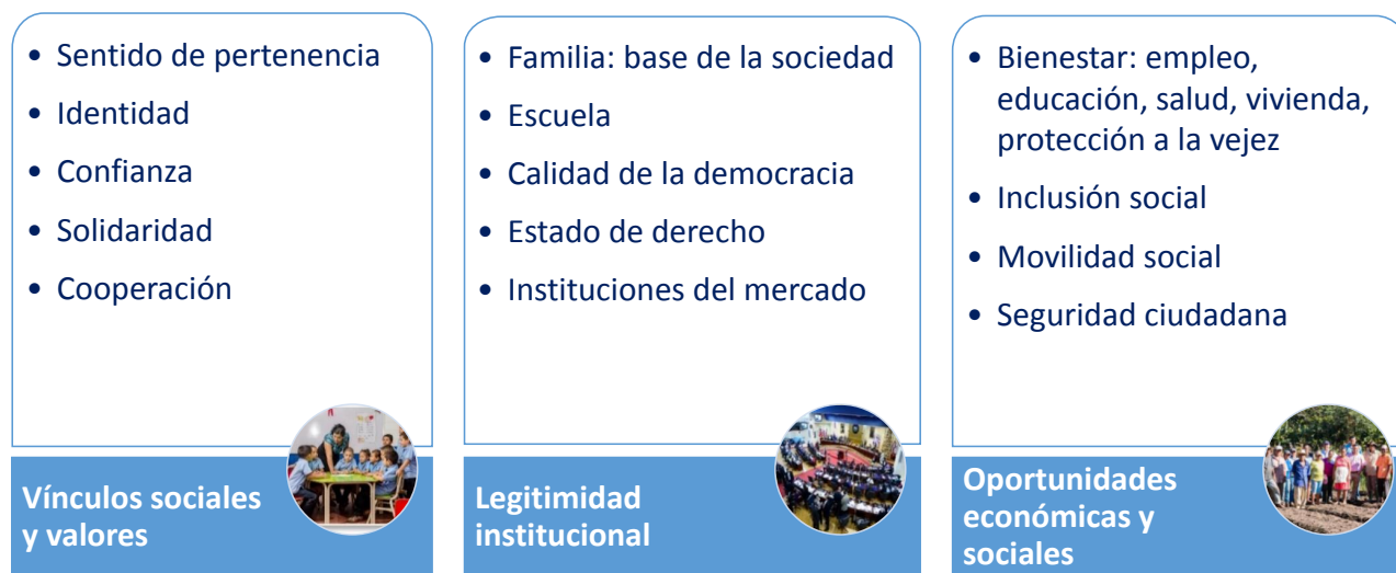
Figura 1 Dimensiones que nutren la cohesión social