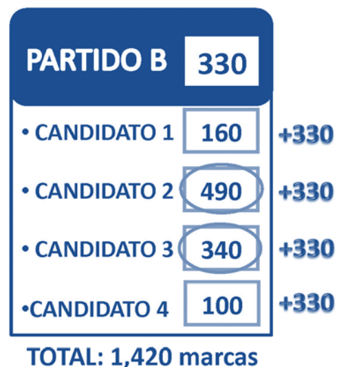
Esquema 2. Asignación individual de escaños

alternativa, que ya contempla el Código Electoral, es la del sorteo.